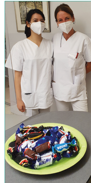
Ambulanz & Augentropfenschulung

Wie sieht es in der Klinik aus? Was geschieht im OP Bereich? Wann müssen die Augen behandelt werden? Besucher*innen informierten sich in Vorträgen zu zahlreichen Themen wie Makuladegeneration, Grauer Star, Hornhauttransplantation und Netzhautablösung. Oder sie legten selbst Hand an bei der Händedesinfektion unter der UV-Lampe oder bei der Gabe von Augentropfen. Im Haus waren unsere Partner und Sponsoren mit Informationsständen vertreten.